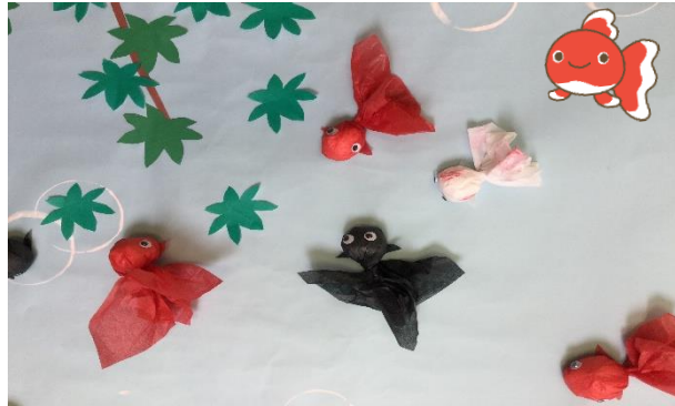
【7月】金魚 目の位置で表情も変わって可愛く出来ました。