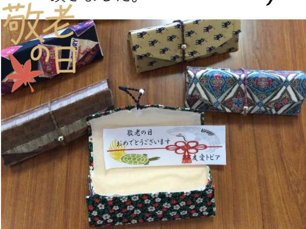
【9月】眼鏡ケース（敬老の日） ご自分で好きな色を選んで制作しました。