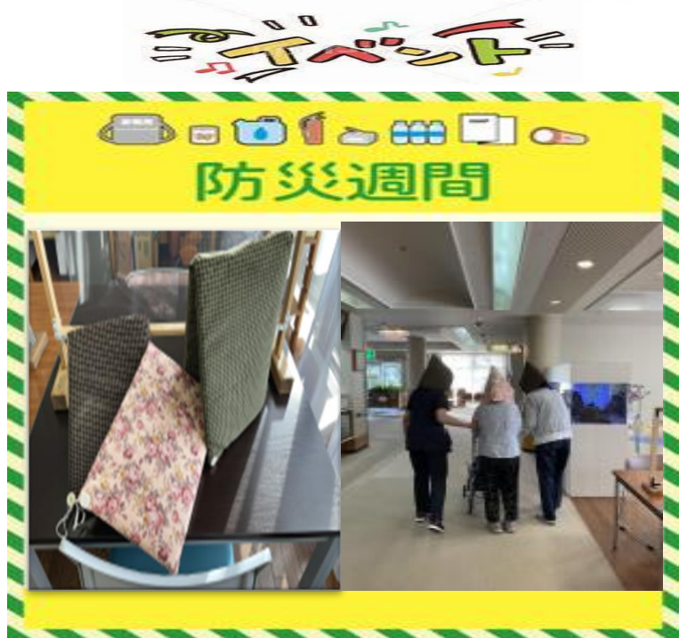
【9月1日】防災の日！ 利用者様に作って頂いた防災頭巾をかぶっています。