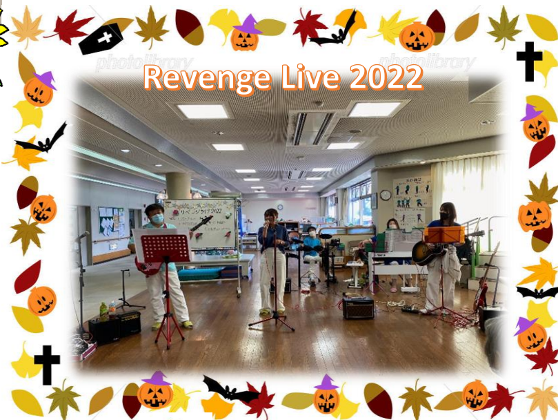
【10月10日】芸術・音楽の秋、生演奏で盛り上がりました！！