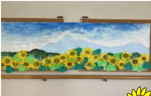
【8月】ひまわり 細かい作業でしたが頑張っておりました。